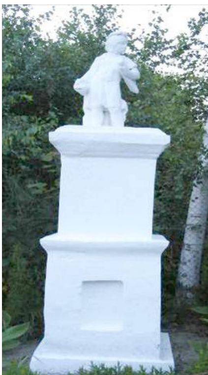
Rys. 16. Na murowanym postumencie kamienna rzeźba św. Floriana z I. poł. w. XIX