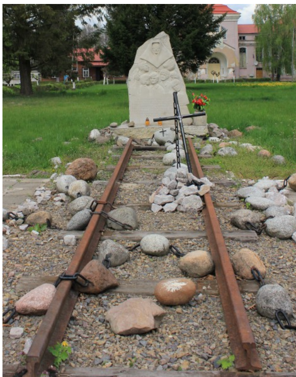
Rys. 15. Pomnik pamięci zamordowanej siostry Longiny i siedmiu wychowanków domu dziecka prowadzonego przez siostry Służebniczki, postawiony w 63 rocznicę ich śmierci