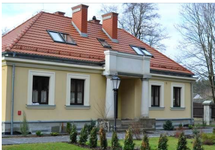
Rys. 10. Budynek mieszkalny sióstr prawosławnych wzniesiony w 2010 roku