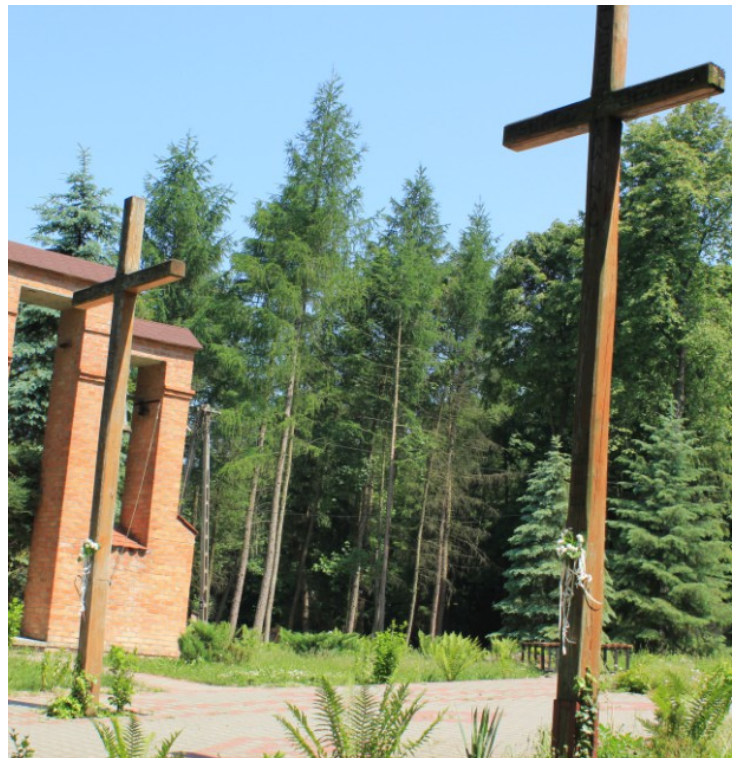
Rys. 12. Krzyże na placu przykościelnym