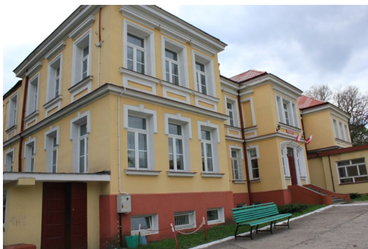
Rys. 7. Dawne Seminarium Żeńskie, następnie siedziba Zespołu Szkół im. J. Poniatowskiego