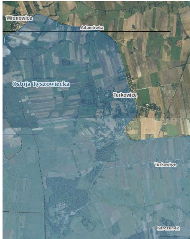
Rys. 28. Obszar Natura 2000 na terenie miejscowości Turkowice

5% populacji krajowej rybitwy białowąsej, powyżej 2% populacji krajowej dzięcioła białoszyjnego oraz co najmniej 1% populacji krajowej dubelta i podróżniczka. Dość liczne występowanie kokoszki, muchołówki białoszyjej i zielonka. Spośród występujących tu kręgowców najciekawszym jest suseł perełkowy. Licznie występuje bóbr europejski, wydra i kumak nizinny. W ostojach bardzo liczne są rzadkie bezkręgowce: motyle dzienne - czerwńczyk fioletek, mieniak strużnik, modraszek alkon, modraszek eumedon, modraszek nausitous, modraszek telejus, strzępotek edypus (jedno z kilku stanowisk w Polsce), strzępotek soplaczek; ważki - lecicha mała, łątka ozdobna (jedyne obecnie potwierdzone stanowisko w Polsce), zalotka białoczelna, zalotka większa i żagnica torfowa.