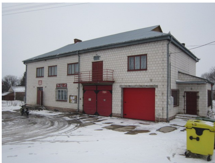
Rys. 20. Świetlino-remiza w Turkowicach