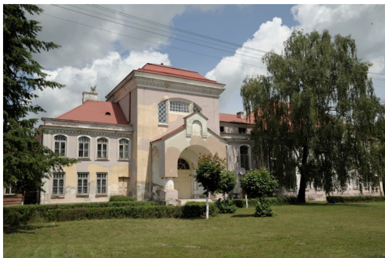
Rys. 9. Budynek wchodzący w skład monasteru