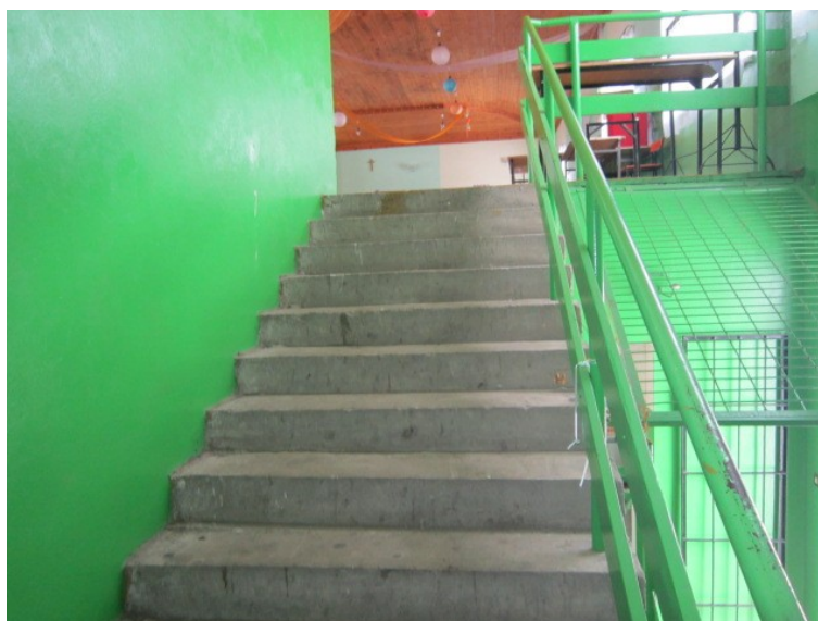
Rys. 23. Wejście na pierwsze piętro