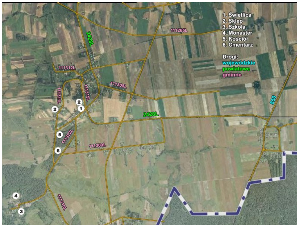
Rys.4. Wizualizacja obszaru o szczególnym znaczeniu dla zaspokojenia potrzeb mieszkańców, sprzyjającego nawiązaniu kontaktów społecznych, ze względu na położenie oraz cechy funkcjonalno-przestrzenne ujęte z lotu ptaka

Dane i potrzeby zamieszczone w opisie uzupełnione są innymi zapisami ww. dokumencie m. in. w pozycji „Struktura przestrzenna miejscowości”, „Obiekty i tereny” oraz „Planowane zadania inwestycyjne i przedsięwzięcia aktywizujących społeczność lokalną”, stanowiąc komplementarną całość opisu miejscowości, jej charakterystyki i potrzeb.