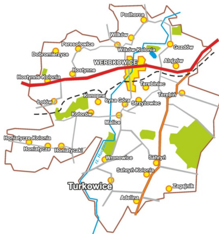
Rys. 2. Miejscowość Turkowice na tle gminy Werbkowice