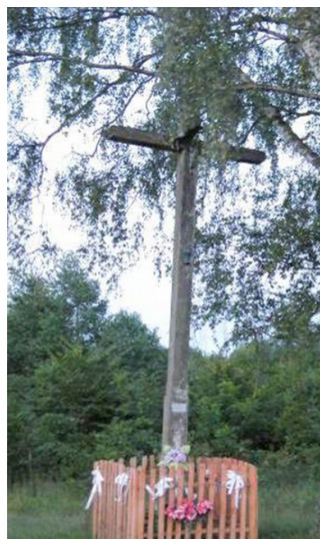
Rys. 14. Przydrożne krzyże.