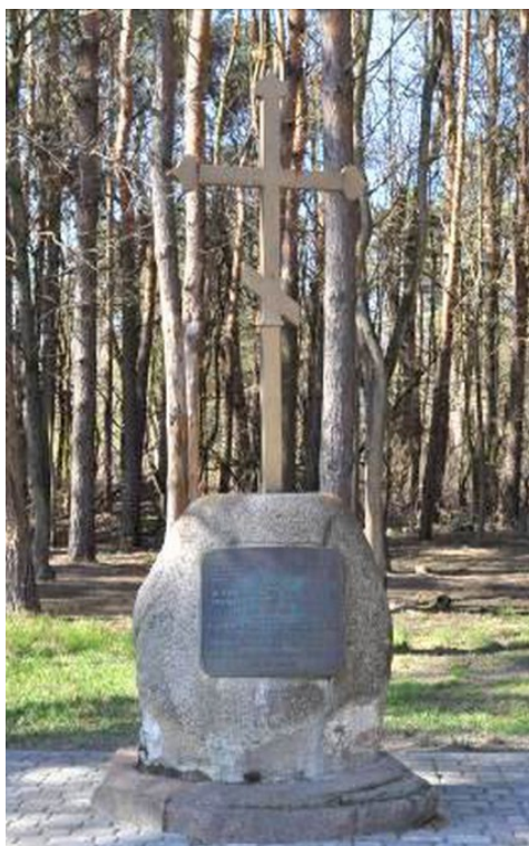
Rys. 13. Krzyż upamiętniający istnienie prawosławnego monasteru w Turkowicach, postawiony w 1999 roku naprzeciwko cerkwi