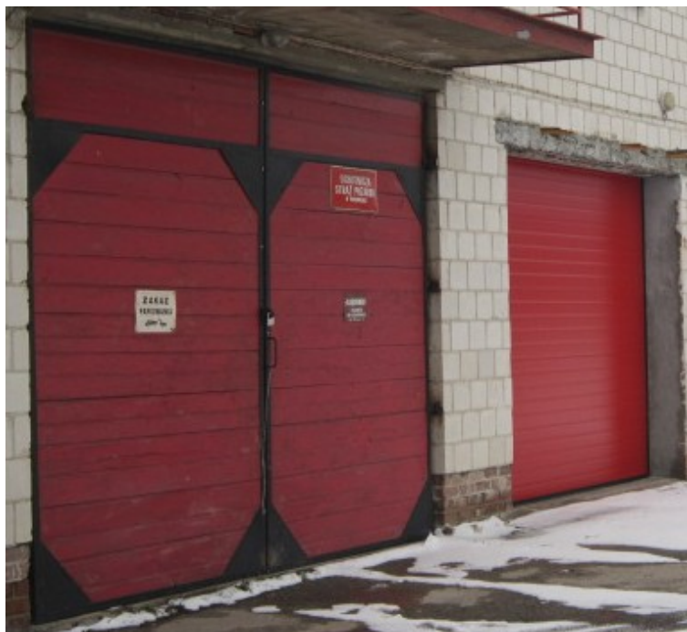
Rys. 24. Garaże OSP w świetlico-remizie w Turkowicach

Jest to najlepiej działająca jednostka OSP w Gminie Werbkowice, dlatego też planowane jest w 2013 roku włączenie jej do Krajowego Systemu Ratowniczo-Gaśniczego.