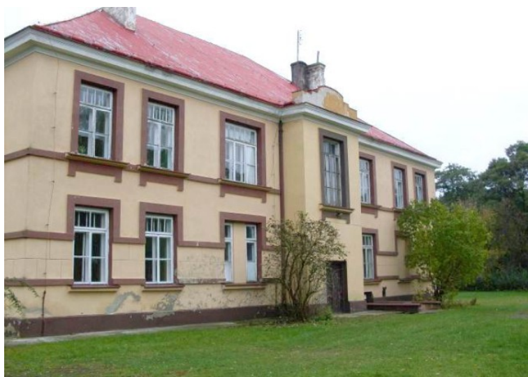
Rys. 8. Dawny Dom dla duchowieństwa, dziś siedziba Publicznej Szkoły Podstawowej