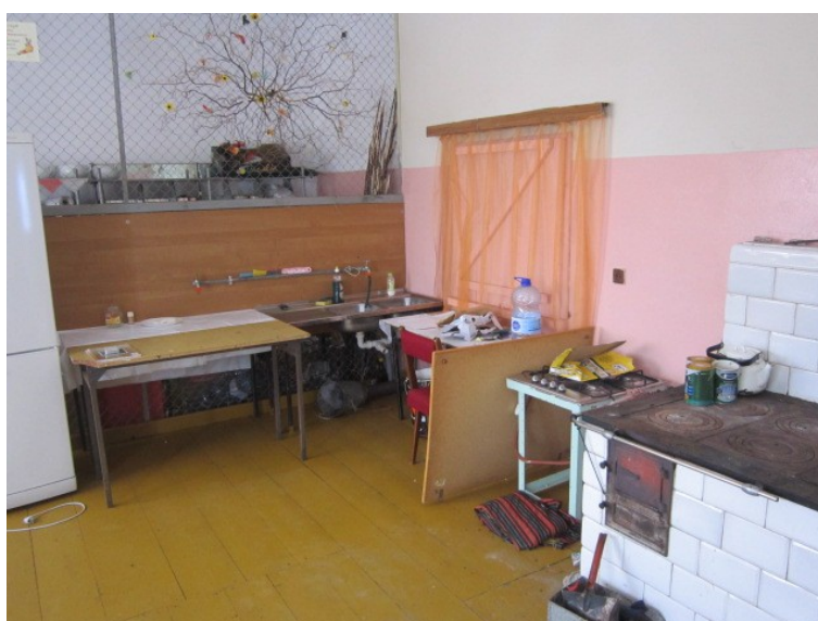
Rys. 21. Pomieszczenie kuchenne