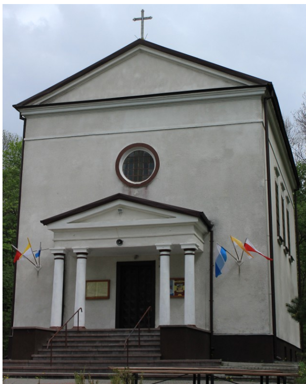
Rys. 18. Kościół parafialny w Turkowicach