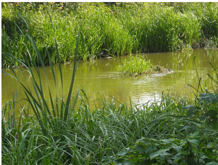
Rys. 5. Huczwa

Na terenie gminy Werbkowice widoczny jest brak wykorzystania potencjału sportowo-rekreacyjnego i stricte turystycznego rzeki Huczwy i terenów bezpośrednio do niej przyległych o bardzo dużej powierzchni. W samej miejscowości Turkowice, jak i na terenie Gminy Werbkowice brakuje infrastruktury około rzecznej. Instytucje prowadzące działalność rekreacyjno-sportową, czy też osoby fizyczne prowadzące działalność agroturystyczną, nie wykorzystują potencjału rzeki, która w znaczący sposób stworzyłaby możliwość rozwoju sektora rekreacyjno-sportowego oraz uzyskania większych dochodów zarówno dla miejscowości Turkowice, jak i całej gminy.