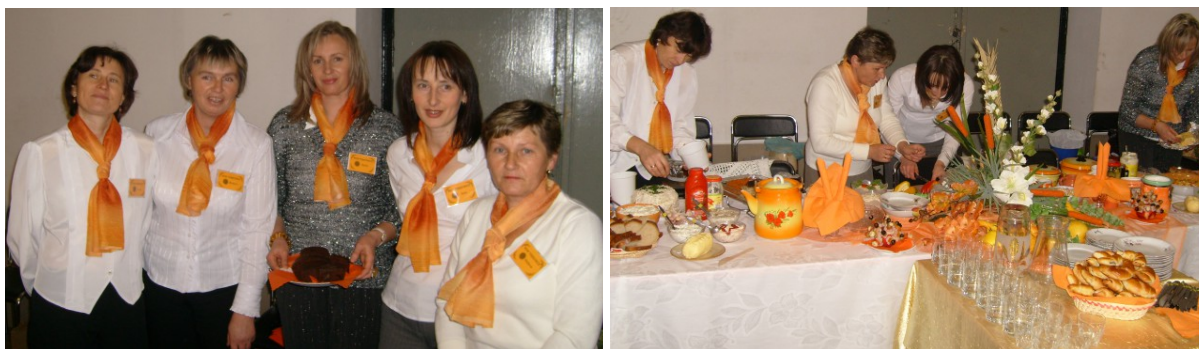
Rys. 25. To one! Kobiety z klasą!

Panie z KGW w Turkowicach, podczas różnych spotkań, np. Dzień Dziecka czy Święto pieczonego ziemniaka, działają w kierunku aktywizacji i integracji społeczności lokalnej sołectwa. Wkładają starania w to, aby nie zapomniano o dziedzictwie, tradycji i obyczajach organizując Spotkania opłatkowe czy Wieczór zapomnianej piosenki. Dla lepszej jakości swoich działań uczestniczą w różnego typu kursach i szkoleniach np. kulinarnych czy z rękodzieła, aby podnieść swoje umiejętności.