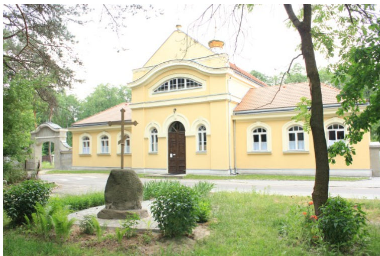
Rys. 6. Dawna „czajniara”przerobiona na cerkiew