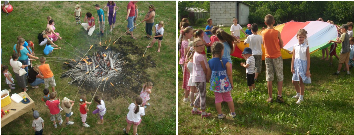
Rys. 27. Aktywizacja społeczności lokalnej