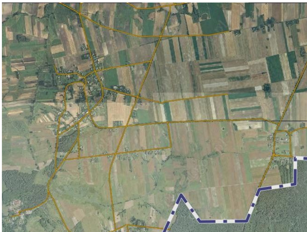
Rys. 3. Turkowice - "Widok z lotu ptaka"

Powierzchnia gminy Werbkowice zajmuje 18826 ha (miejscowość Turkowice 1239,32 ha, w tym użytki rolne stanowią 1077,678 ha, natomiast lasy 66,1 ha). Gminę Werbkowice tworzy 28 sołectw, w tym sołectwo Turkowice. Jest gminą rolniczo-przemysłową z nastawieniem na przemysł rolno-spożywczy.