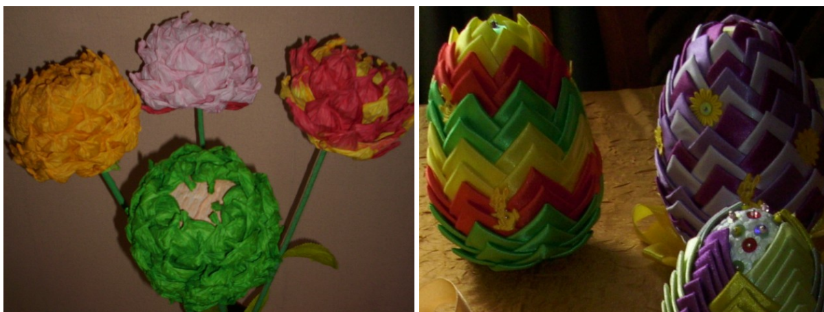
Rys. 26. Rękodzieło wykonane przez Panie z KGW