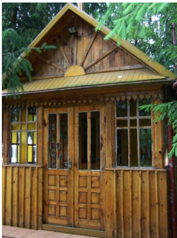
Rys. 17. Kaplica pw. Bożego Pokoju