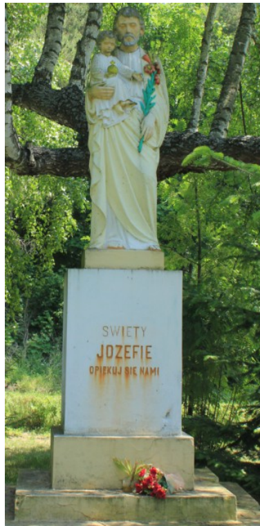
Rys. 11. Pomnik z figurą Świętego Józefa z inskrypcją: „Wdzięczni za ocalenie w czasie wojny 1939-45 ten pomnik wznosimy 1948 r.” Mieszkańcy postawili ten pomnik jako votum dziękczynne za ocalenie i przetrwanie tuż po wizycie Księdza Biskupa Stefana Wyszyńskiego w 1947 roku w Zakładzie”