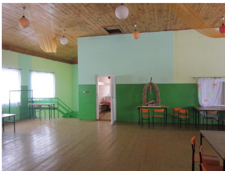
Rys. 22. Sala taneczna