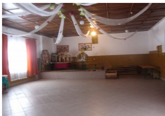
Rysunek 19: Sala widowiskowa