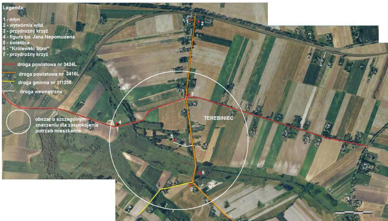
Rysunek 20: Wizualizacja obszaru o szczególnym znaczeniu dla zaspokojenia potrzeb mieszkańców, sprzyjającego nawiązaniu kontaktów społecznych, ze względu na położenie oraz cechy funkcjonalno-przestrzenne ujęte z lotu ptaka.

Dane i potrzeby zamieszczone w opisie uzupełnione są innymi zapisami ww. dokumencie m. in. w pozycji "Struktura przestrzenna miejscowości", "Obiekty i tereny" oraz "Planowane zadania inwestycyjne i przedsięwzięcia aktywizujące społeczność lokalną", stanowią komplementarną całość opisu miejscowości, jej charakterystyki i potrzeb.