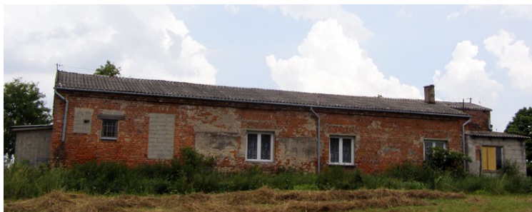
Rysunek 16: Świetlica w Terebińcu

odbywa się przy muzyce prezentowanej dla każdego pokolenia w formie festynu rodzinnego.