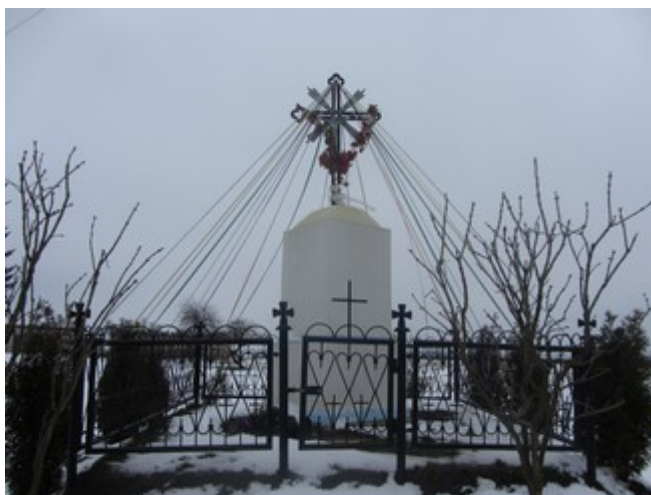
Rysunek 10: Przydrożny krzyż