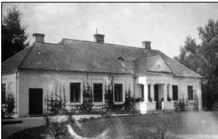
Rysunek 3: Dwór murowany w Terebińcu, fot. z archiwum WUOZ w Lublinie, Delegatura w Zamościu

majątku. Tutejszy folwark kupił wówczas Kazimierz Dobiecki, ale w 1946 roku przejęto go na Skarb Państwa.