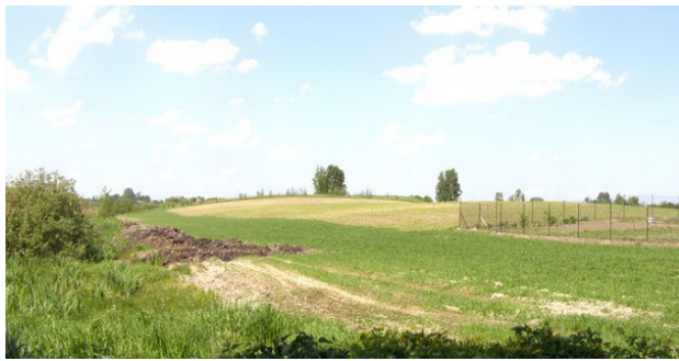
Rysunek 14: "Góra Rybki"