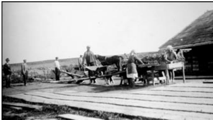
Rysunek 6: Cegielnia dworska w Terebińcu, fot. z archiwum WUOZ w Lublinie, Delegatura w Zamościu

tu karczma, w części Podhoreckiego, która uzyskała patent na dalsze prowadzenie wyszynku alkoholu. Dobra Terebińca składały się w 1866 roku z folwarku Terebiniec i Strzyżowiec o powierzchni 3368 mórg. Wieś Terebiniec liczyła 100 domów i 987 mórg ziemi włościańskiej. Do folwarku należała także cegielnia.