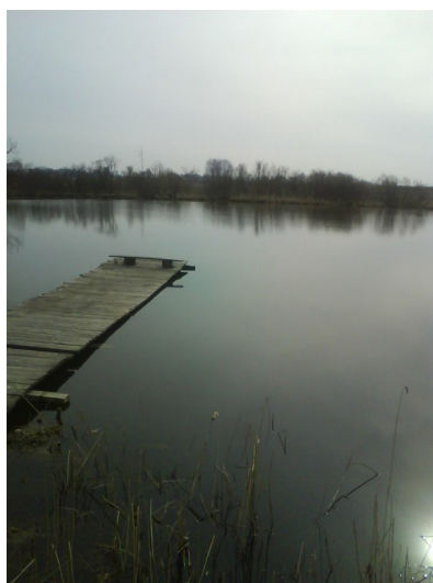
Rysunek 8: Królewski Staw

uroków stawu jest niczym nieograniczona. Posiada niezróżnicowaną linię brzegową, która łagodnie przechodzi w łąkę. Staw i jego okolica należą do terenów o dużych walorach przyrodniczych i krajobrazowych. Linię brzegową porasta roślinność wynurzona, tworząc miejscami dość szerokie pasma szuwarów, w których dominuje głównie pałka. Występuje roślinność wodna i bagienna tj.: trzcina pospolita, pałka szerokolistna, pałka wąskolistna, tatarak zwyczajny, rzęsa drobna, rogatek sztywny, rogatek krótkoszyjkowy, kosaciec żółty. Linia brzegowa porośnięta jest również różnej wielkości krzewami. Wzdłuż brzegu akwenu i w szuwarach występują żaby z grupy zielonych. W samym zbiorniku, żyje kilka gatunków ryb i akwen ten jest wykorzystywany przez wędkarzy. Spotykamy tu ryby tj.: okoń, szczupak pospolity, płoć, leszcz, ukleja. W wodzie rozwijają się również bezkręgowce stanowiące ważne ogniwo w sieci pokarmowej. Z owadów spotykamy tu larwy ochotek i innych muchówek jak również larwy ważek oraz chrząszczy wodnych. Na tafli wody możemy również obserwować nartniki reprezentujące rząd pluskwiaków różnoskrzydłych.