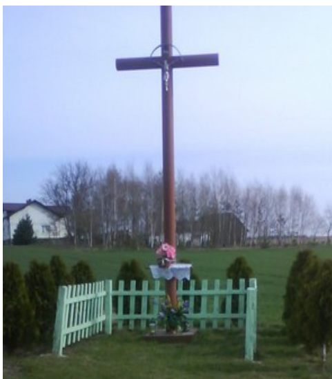
Rysunek 9: Przydrożny krzyż