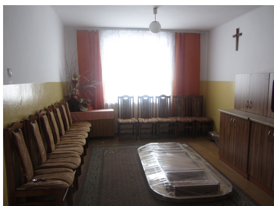
Rysunek 18: Sala spotkań