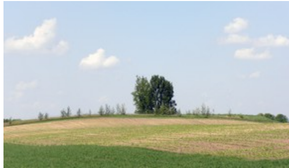
Rysunek 15: Góra Rybki