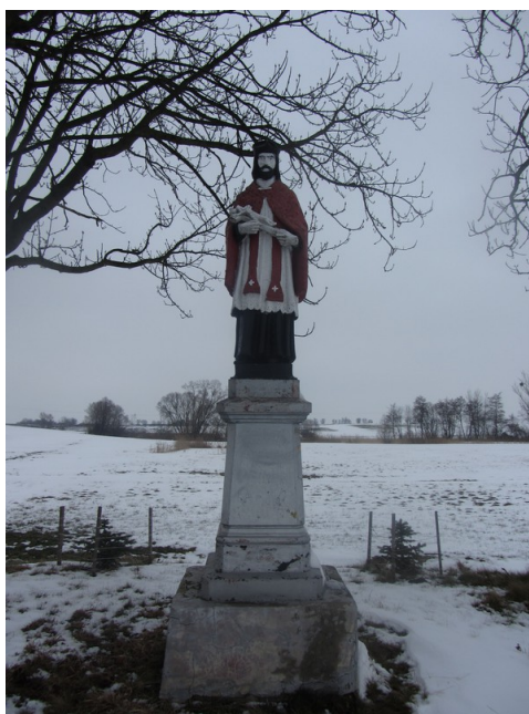
Rysunek 11: Figura przedstawiająca św. Jana Nepomucena