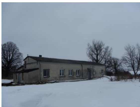
Rysunek 17: Świetlica w Terebińcu