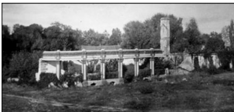
Rysunek 5: Ruiny spalonego dworu w Terebińcu

Spis z 1827 roku notował wieś w powiecie hrubieszowskim i parafii Hrubieszów. Liczyła wówczas 24 domy i 205 mieszkańców. W 1845 roku istniała