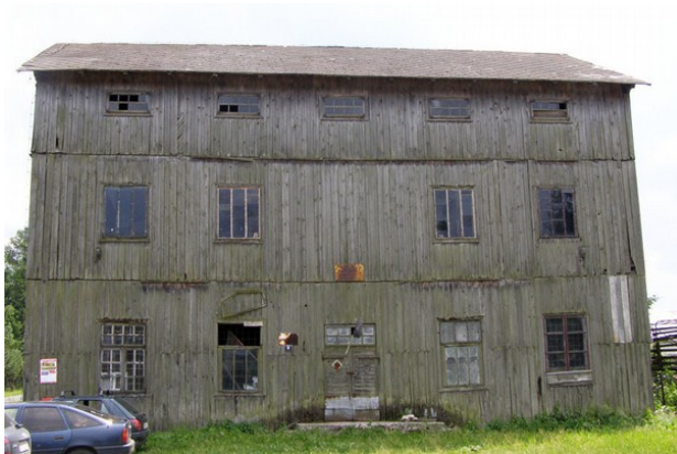
Rysunek 12: Młyn w Terebińcu