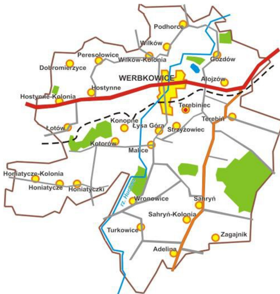
Rysunek 2: Miejscowość Terebiniec na tle Gminy Werbkowice