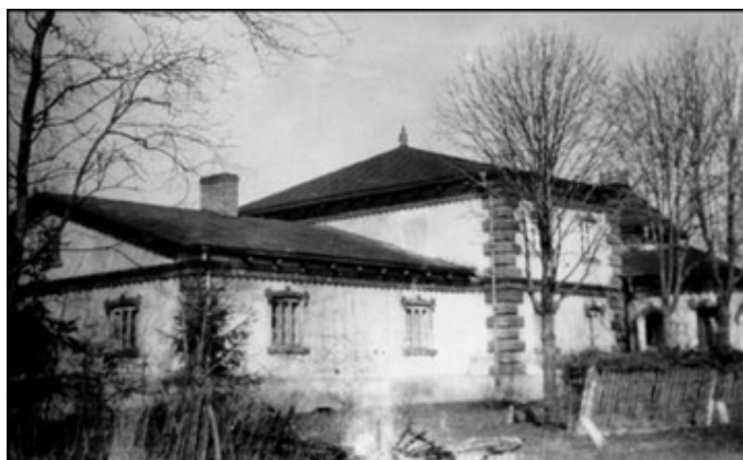
Rysunek 4: Jeden z budynków dworskich tzw. „belweder” w Terebińcu, fot. z archiwum WUOZ w Lublinie, Delegatura w Zamościu