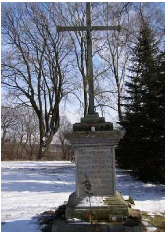
Rys. 17. Kamienny postument z żeliwnym krzyżem na cmentarzu przykościelnym