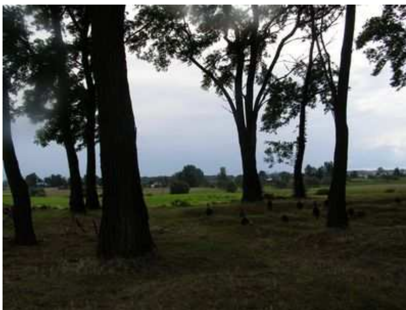
Rys. 19. Mogiły ziemne na cmentarzu z I wojny światowej

Cmentarz z I wojny światowej - założony został w 1915 roku, po bitwach w lipcu i sierpniu tegoż roku. Jest położony 700 m na północ od wsi, poza zabudową, przy drodze z Gozdowa i Brodzicy do Podhorzec, na wyniesieniu terenowym. Posiada kształt zbliżony do ćwiartki koła o powierzchni 0,12 ha. Mogiły zbiorowe i indywidualne ułożone są w równoległych rzędach. Północno – zachodni narożnik jest wolny od pochówków. Na cmentarzu znajduje się 9 mogił zbiorowych i 39 mogił indywidualnych. Mogiły ziemne, zadarnione, na nich 6 żeliwnych krzyży z tablicami umieszczonymi na skrzyżowaniu ramion. Inskrypcje są odlewane. Krzyże są częściowo uszkodzone. Zachowały się tablice i belki pionowe. W części północnej, na wprost wejścia stoi wysoki krzyż drewniany. Cmentarz oddany był renowacji w 1993 roku. W wyróżnionych mogiłach pochowani są żołnierze armii austriackiej polegli w dniach 3.VII. - 7. VIII. 1915 roku oraz prawdopodobnie żołnierze armii rosyjskiej (w mogiłach zbiorowych). Występują robinie akacjowe pochodzące z samosiewów. Rosną na obrzeżu cmentarza, w części wolnej od pochówków i na mogiłach zbiorowych. Występują tu również krzewy śnieguliczki. Ogrodzenie stanowią pozostałości kamiennego muru z wejściem od strony północnej