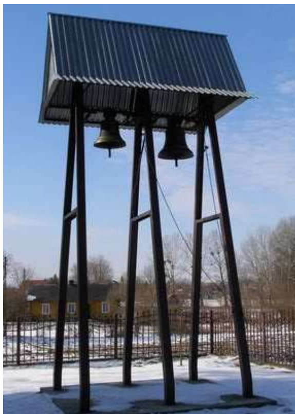
Rys. 30. Dzwonnica o metalowej konstrukcji z 2004 roku