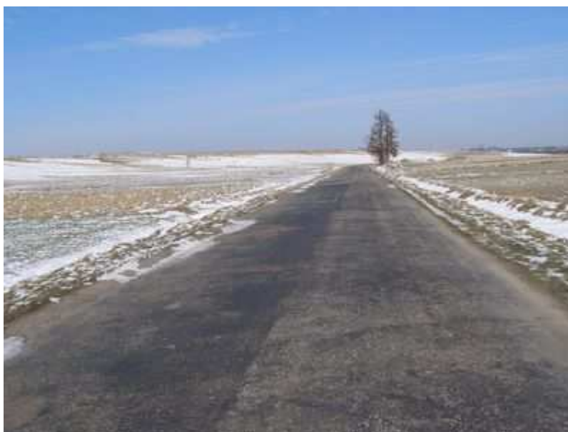
Rys. 42. Droga powiatowa Wilków – Podhorce - Nieledew