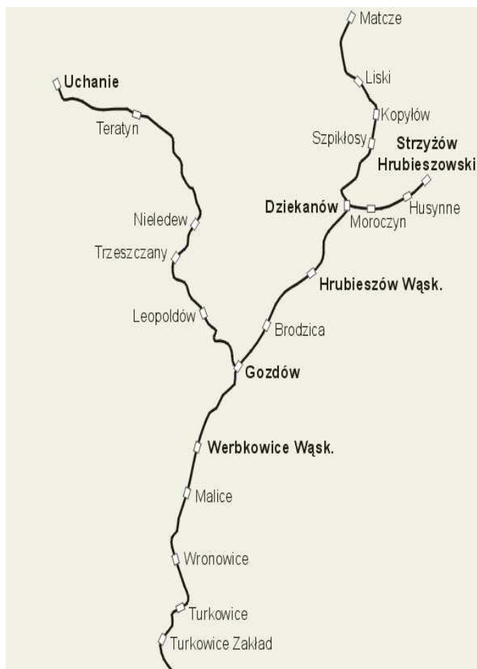
Rys. 24. Hrubieszowska Kolej Dojazdowa – przebieg linii na terenie obecnego powiatu

Decyzją Wojewódzkiego Konserwatora Zabytków w Zamościu (D.4000/13/92 z 27.11.1992 r.) przestrzenny układ komunikacyjny Hrubieszowskiej Kolei Dojazdowej na odcinku Werbkowice – Gozdów - Hrubieszów wpisany został do rejestru zabytków województwa zamojskiego w dziale A pod nr 502.