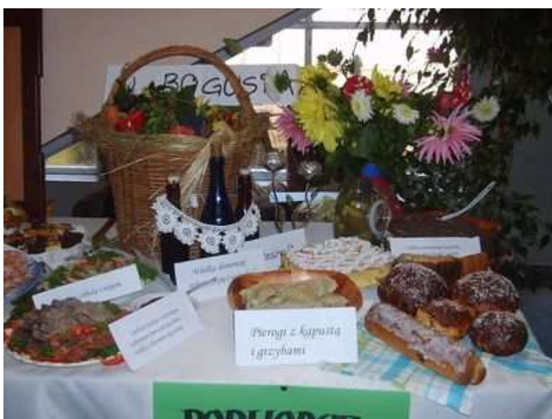
Rys. „Biesiada u sołtysa” w Gminnym Ośrodku Kultury