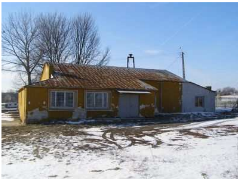
Rys. 32. Świetlico - remiza wiejska