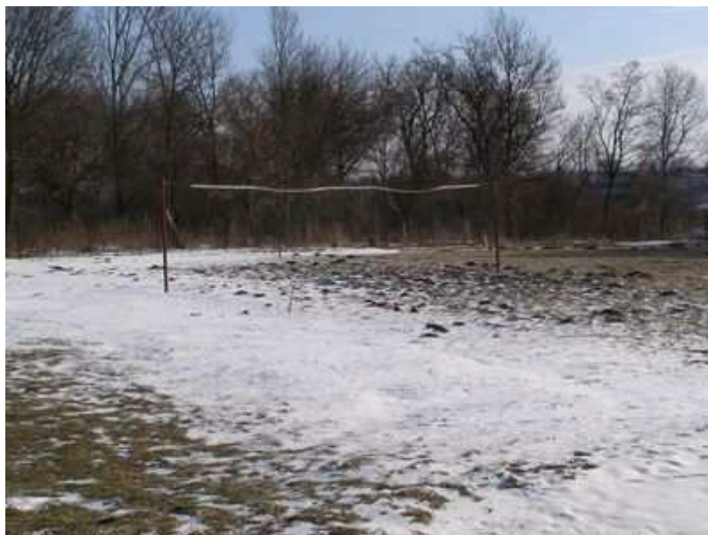
Rys. 40. Boisko do piłki siatkowej