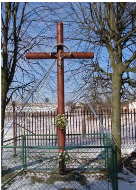
Rys.1 1. Krzyż przydrożny