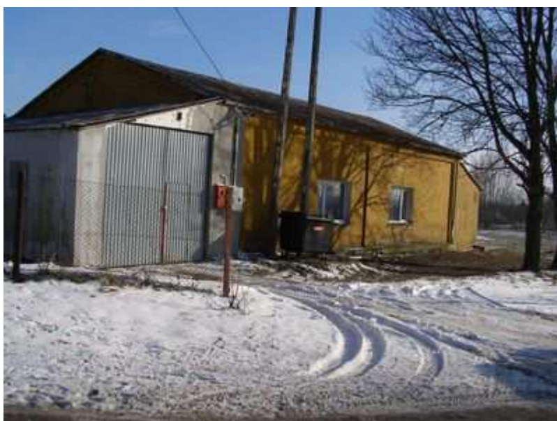
Rys. 33. Świetlico - remiza wiejska