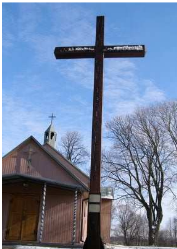
Rys. 13. Drewniany krzyż na placu kościelnym „Z Jezusem w trzecie tysiąclecie”

Na placu kościelnym znajduje się drewniany krzyż z końca XX wieku. Na krzyżu znajdują się dwie tabliczki upamiętniające wyjątkowe wydarzenia w parafii. Na pierwszej widnieje inskrypcja: „Pamiętka jubileuszowych misji św. przeprowadzonych przez ks. kan. Aleksandra Bacę misjonarza diecezjalnego Podchorce 5 – 12 XI 2000”, na drugiej zaś: „Pamiętka parafialnych misji św. przeprowadzonych przez oo. bernardynów z Hrubieszowa Podchorce 30 V – 6 VI 2010”