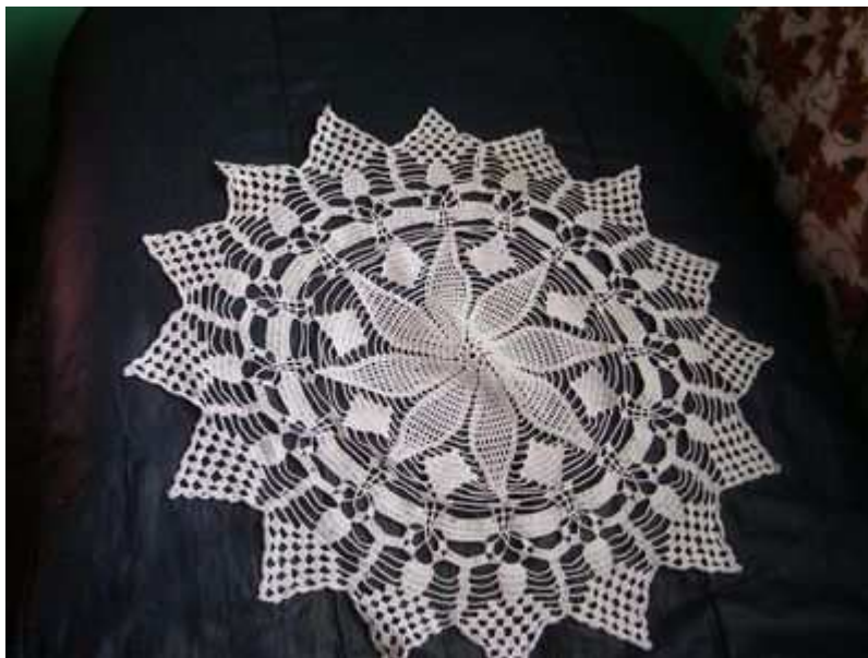
Rysunek. 25. Serwetka wykonana za pomocą szydełka