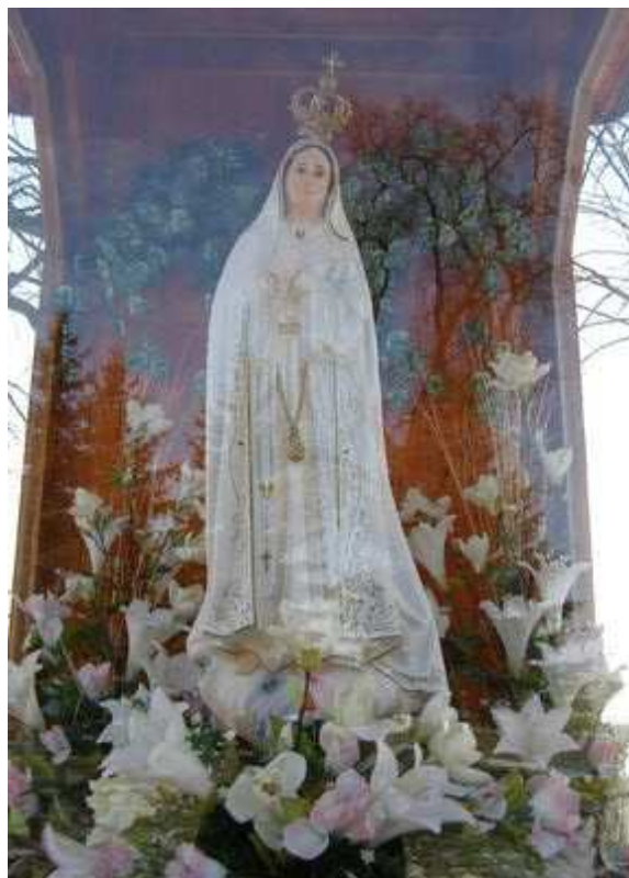
Rys.16. Figura Matki Boskiej w drewnianej kapliczce na placu kościelnym