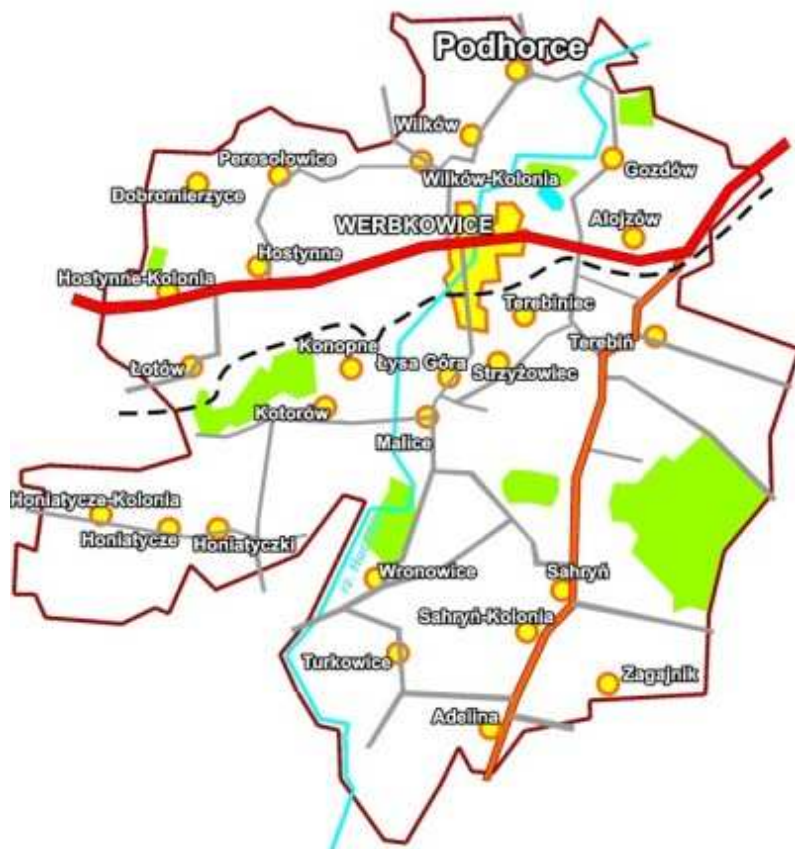
Rys. 2. Miejscowość Podhorce na tle gminy Werbkowice