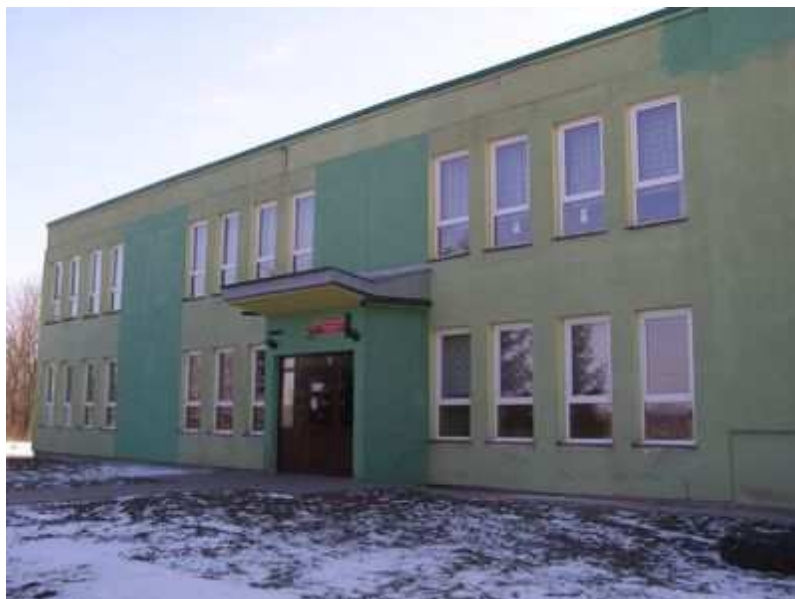
Rys. Publiczna Szkoła Podstawowa im. Jana Pawła II w Podhorcach