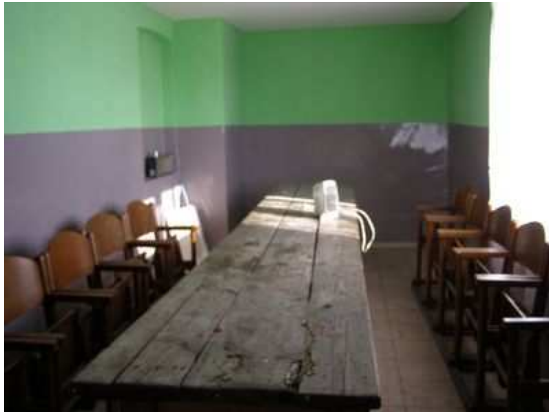
Rys. 36. Miejsce spotkań młodzieży w świetlico – remizie