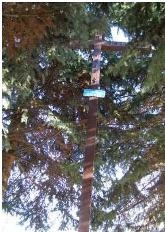
Rys. 14. Metalowy Krzyż na placu kościelnym „Pamiątka misji św. serce Jezusa 5 XII 1982”

Na placu kościelnym w zaciszu utworzonym ze świerków stoi metalowy krzyż z 2 poł. XX wieku, pamiątka misji św. z 5 XII 1982 roku. Na krzyżu znajduje się również tabliczka z inskrypcją „Pamiątka misji św. 23 – 25 VI 1997”