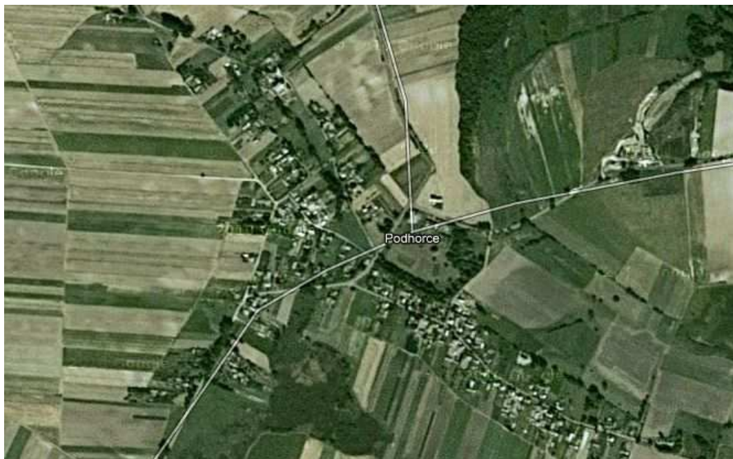
Rys.3. Podhorce z lotu ptaka