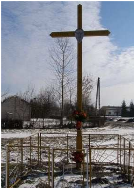
Rys. 7. Przydrożny krzyż drewniany „Pamiętka wizyty Papieża Jana Pawła II” 16 VI 1983 roku

poł. XX wieku. Wszystkie te obiekty są szczególnym miejscem kultu wiary chrześcijańskiej. Przy krzyżach corocznie w miesiącu maju odbywają się spotkania modlitewne zwane "majówkami", oraz poświęcenie pól.