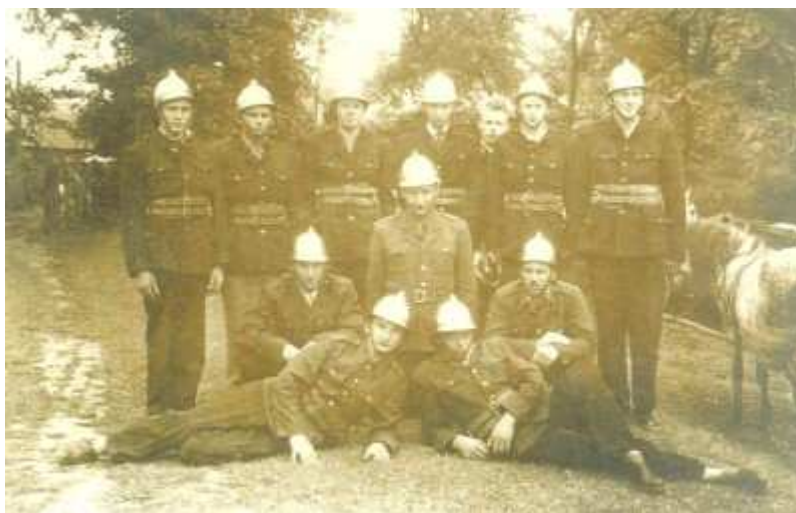
Rys. OSP Podhorce

Wilków. Podczas 2010 roku była wzywana 16 razy do akcji zwalczania skutków podtopień na terenie gminy.