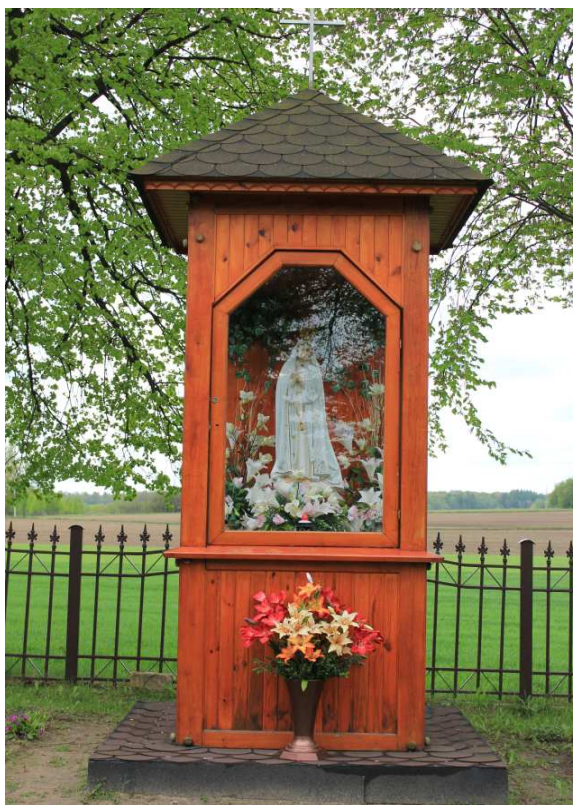
Rys. 15. Drewniana kapliczka na placu kościelnym.

Wybudowana w 2008 roku na cmentarzu kościelnym drewniana kapliczka p.w. Matki Bożej Fatimskiej, którą poświęcono 24 sierpnia br.