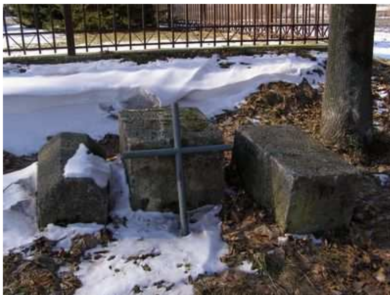
Rys. 18. Pozostałości nagrobków na cmentarzu przykościelnym

Cmentarz prawosławny - obecnie jest nieczynny. Położony 1000 m na południe od kościoła, przy drodze polnej prowadzącej do łąk i rzeki Huczwy, poza zabudową. Jest to prostokąt o powierzchni 0,3 ha, bez podziału na kwadraty. Groby są w rzędach, skierowane na wschód i zachód. Na cmentarzu zachowało się ok. 30 kamiennych i betonowych nagrobków oraz ich fragmentów sprzed 1945 roku. Jedynie dwa nagrobki zachowały się w