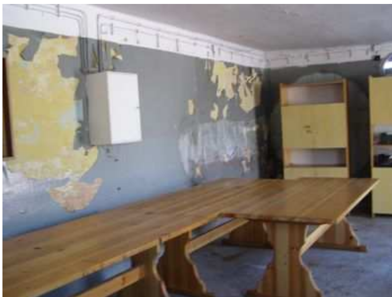
Rys. 38. Miejsce spotkań KGW