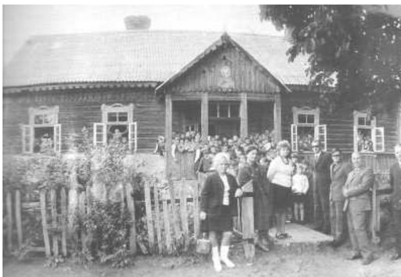
Rys. 4. Drewniana szkoła w Podhorcach 1947 r.