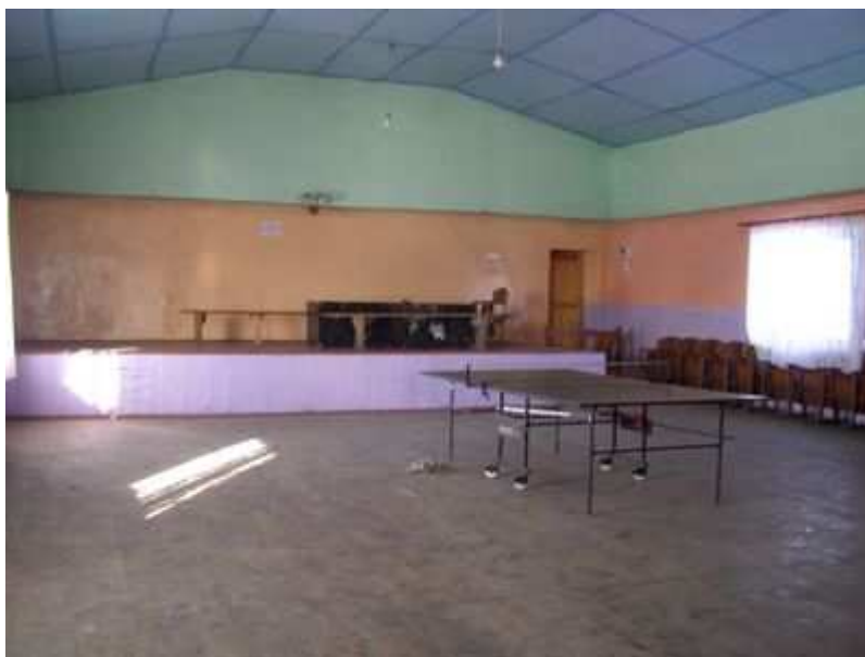
Rys. 35. Sala taneczna ze sceną

Pomimo powyższych braków organizowane są w świetlicy dużym nakładem społecznym, imprezy dla mieszkańców. W programie festynów są konkursy i zabawy dla dzieci przeprowadzone przez pracowników GOK Werbkowice. W trakcie imprezy uczestnicy delektują się ciastem upieczonym przez panie z KGW, oraz grochówką, potrawami z grilla oraz napojami. Wszystko odbywa się przy muzyce prezentowanej dla każdego pokolenia w formie festynu rodzinnego.