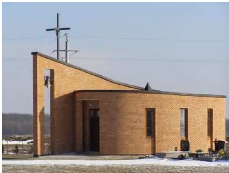
Rys. 22. Kaplica na cmentarzu grzebalnym

W 2008 roku opracowano wstępny projekt kaplicy cmentarnej na cmentarzu grzebalnym, a w 2009 roku już wybudowano kaplicę w stanie surowym. W 2010 roku w kaplicy wykonano wiele remontów: docieplono stropodach i okuto kapinosy blachą, wykonano instalację elektryczną, tynki wewnętrzne, drzwi zewnętrzne - 3 szt., posadzkę i terakotę, kinkiety, żyrandole, zamontowano 6 okien. Ks. Proboszcz ufundował dzwon, ołtarz, ambonkę, naczynia, księgi i szaty liturgiczne. Ustawiono szafę na paramenty liturgiczne w zakrystii.