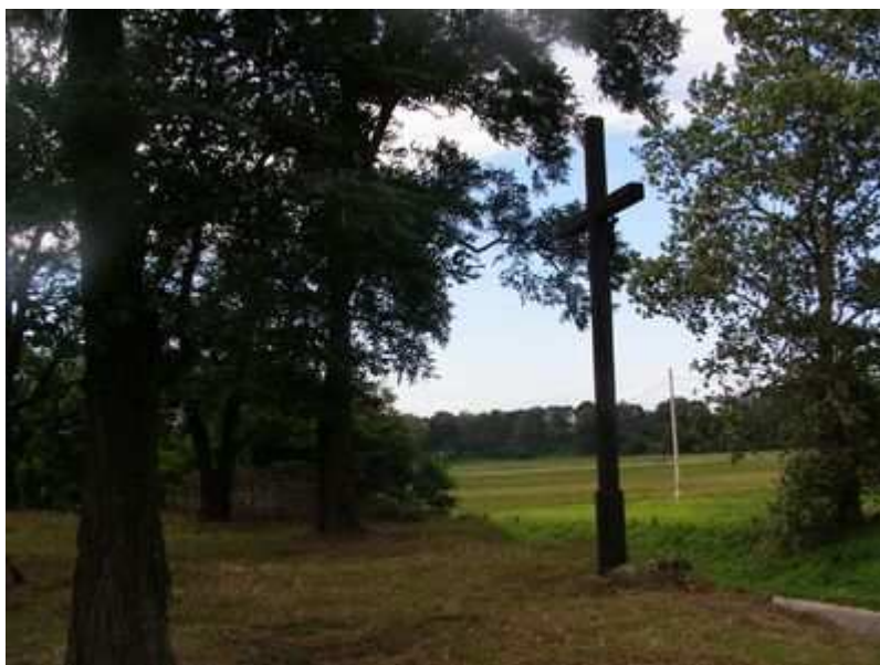
Rys. 20. Krzyż na cmentarzu z I wojny światowej