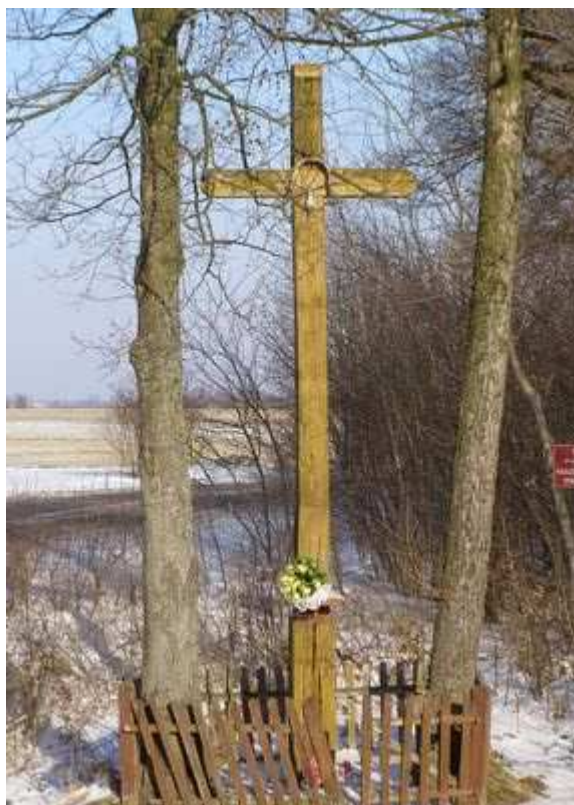
Rys. 8. Przydrożny krzyż

Na terenie miejscowości Podhorce znajduje się krzyż postawiony z wdzięczności za ocalenie w 1902 roku. Nieznany jest fundator, ale jego niezwykłość tkwi w tym, że jest to krzyż prawosławny jedyny tego typu ślad bytności ludności wyznania grekokatolickiego. Ten krzyż to również dowód wielkiej tolerancji i szacunku obecnych mieszkańców, którzy nie zniszczyli obiektu, traktując go jako zabytek i błogosławione miejsce. Pozostawienie w nienaruszonym stanie tego obiektu to dowód szacunku Polaków do religii, do Boga, do ludzi, do świętków, które błogosławią łanom bez względu kto je zbudował.