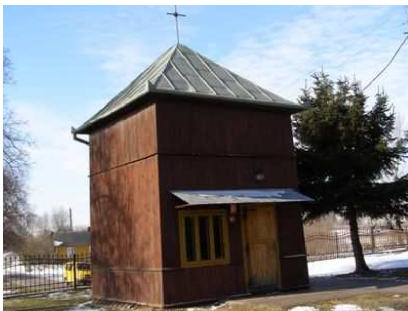
Rys. 31. Drewniana dzwonnica z XVIII w.