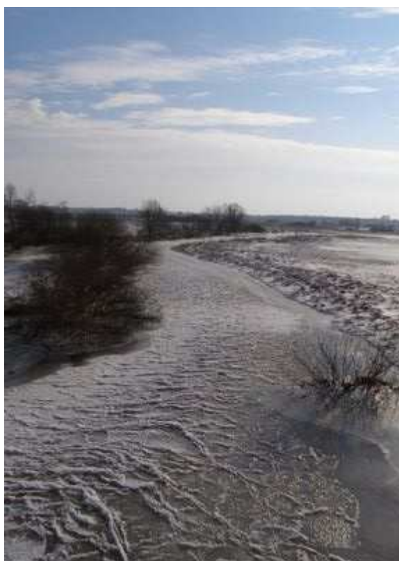
Rys. 6. Rzeka Huczwa