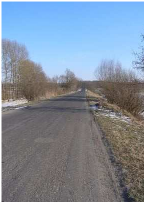
Rys. 41 Droga powiatowa Podhorce – Terebiń