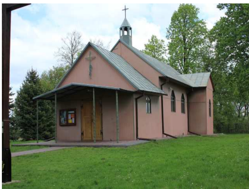
Rys. 29. Kościół Filialny p. w. Św. Biskupa Stanisława

Obok kościoła stoi drewniana dzwonnica z XVIII w., o konstrukcji słupowo ramowej, z zewnątrz oszalowana, czworoboczna, dach namiotowy przykryty blachą. Wewnątrz tej dzwonnicy znajduje się mała sala katechetyczna. Obok dzwonnicy na metalowej konstrukcji zawisły 2 dzwony: "Jan Paweł II" oraz "Maryja - Pani Jasnogórska". Jest metalowy krzyż misyjny z 1983 roku i drewniany z 2000 oraz drewniana kapliczka Matki Bożej Fatimskiej z 2008 roku. Cmentarz przykościelny, (a dawniej także grzebalny - dziś zachowany jest tylko jeden grobowiec) ogrodzono w latach 2000-2001 nowymi, metalowymi przesłami.