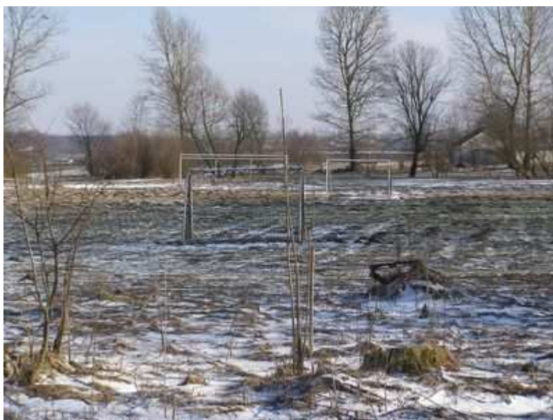
Rys. 39. Boisko do piłki nożnej

Usytuowane jest w centrum Podhorzec, w sąsiedztwie Szkoły Podstawowej i świetlicy - remizy. Niepełnowymiarowe boisko do piłki nożnej w bardzo złym stanie technicznym (zdeństwowana nawierzchnia trawiasta, brak infrastruktury przy boiskowej typu: zaplecze sportowe, ogrodzenie, trybuny).