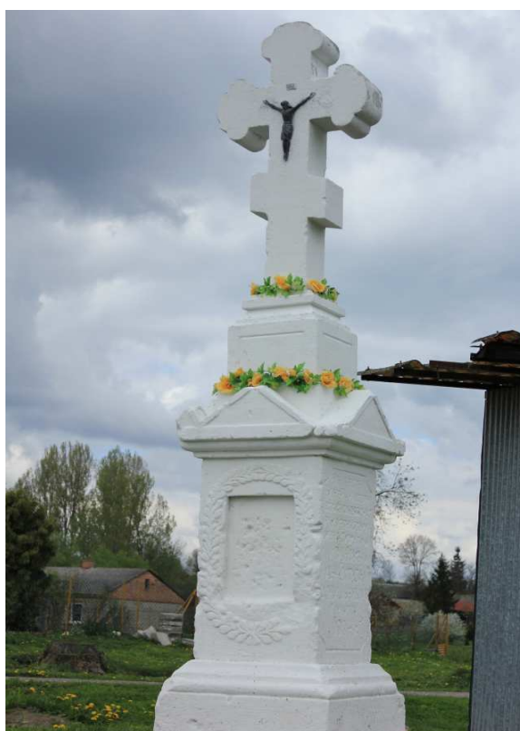
Rys. 10. Krzyż postawiony z wdzięczności za ocalenie 31. V. 1902 roku