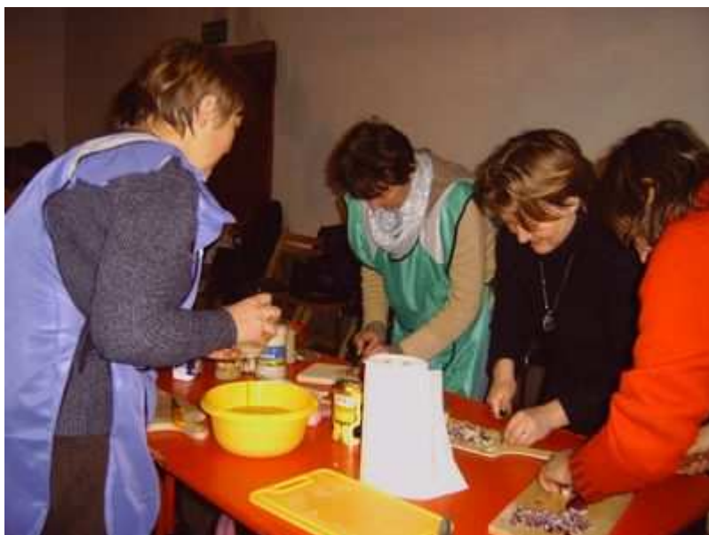
Rys. W Kole Gospodyń Wiejskich „praca wre”