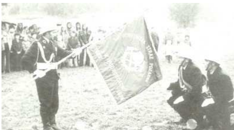
Rys. OSP Podhorce