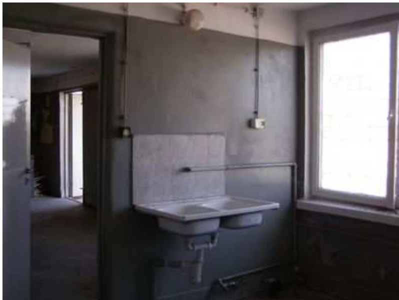
Rys. 37. Pomieszczenie kuchenne