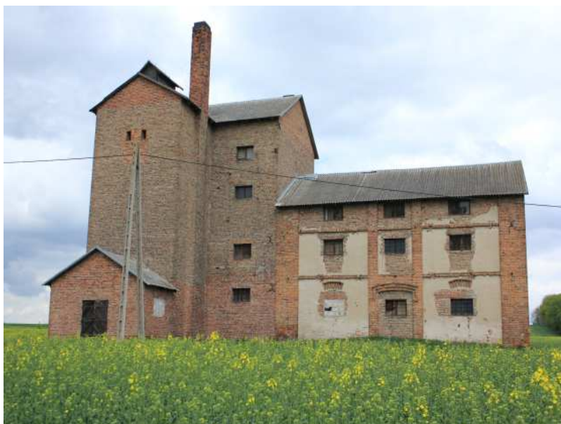
Rys. 23. XIX – wieczna gorzelnia