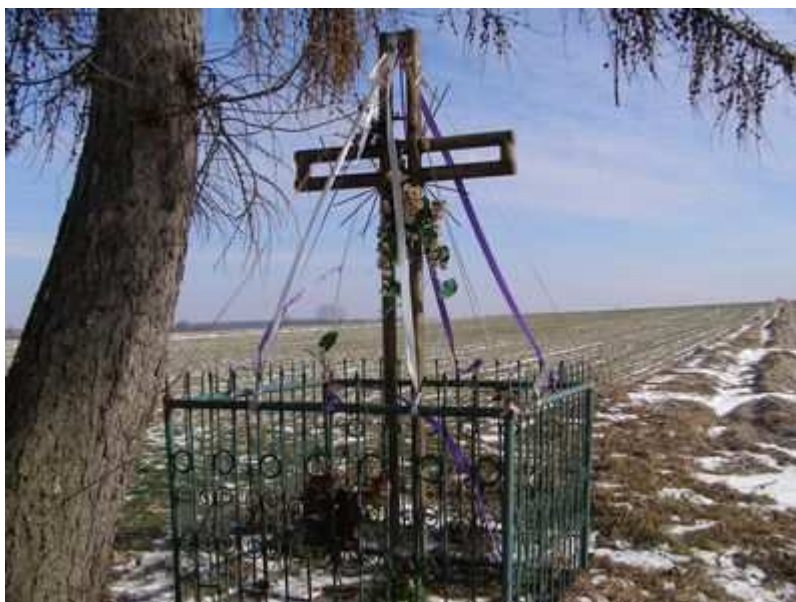
Rys. 9. Krzyż graniczny z 1960 roku symbol przyjaznego sąsiedztwa wsi Wilków – Podhorce