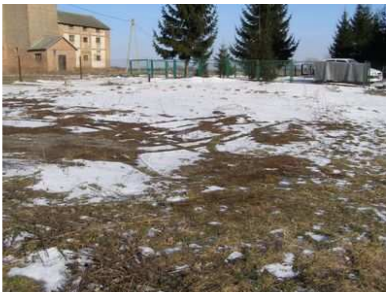
Rys.34. Plac przed świetlicą - remizą

Świetlica powstała w 1925 roku. Obiekt murowany, parterowy. Budynek remizo-świetlicy wolno stojący, parterowy nie podpiwniczony, konstrukcji murowanej w formie prostokąta z dachem wielospadowym konstrukcji drewnianej krokwiowo-jętkowej. Budynek posiada dwa niezależne wejścia. Pierwsze wejście prowadzi do sali tanecznej ze sceną i małego pomieszczenia, gdzie odbywają się spotkania młodzieży. Drugie wejście prowadzi do pomieszczenia, które obecnie jest wykorzystywane przez KGW, z tego miejsca przechodzi się do niewielkiej kuchni, gdzie jest bieżąca woda, niewielki sanitariat i schowek (wcześniej ta część był użytkowana przez mleczarnię). Część stanowiąca remizę obejmuje 1 pomieszczenie pełniące funkcje siedziby i garażu OSP. Cały obiekt jest ogrodzony siatką, bez głównej bramy wjazdowej, teren nie jest zagospodarowany (m.in. brak utwardzonego placu dojazdowego, obiektów małej infrastruktury typu: plac zabaw, boiska sportowo – rekreacyjnego).