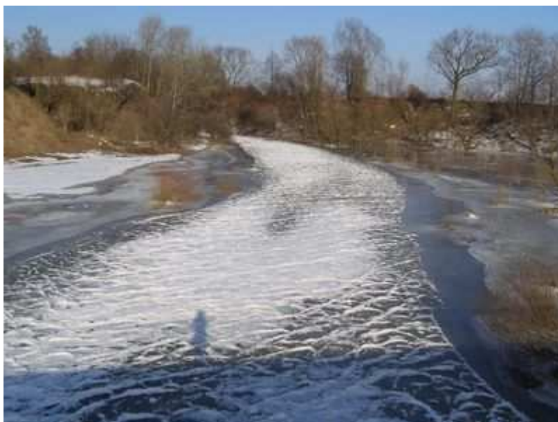
Rys. 5. Rzeka Huczwa