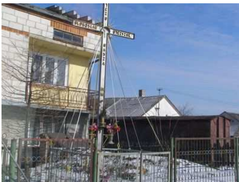
Rys. 12. Krzyż przydrożny „Jezu błogostaw ojczyznę naszą” 16 VI 1983 rok