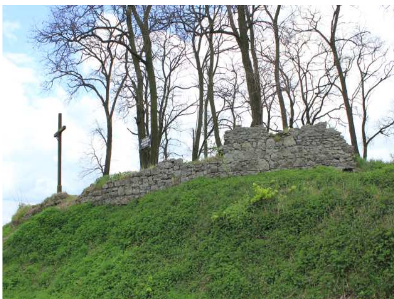
Rys. 21. Pozostałości muru cmentarza z I wojny światowej

Cmentarz grzebalny – nowo utworzony cmentarz. Należy do Parafii Rzymskokatolickiej Miłosierdzia Bożego w Gozdowie. Położony jest 700 m na północ od wsi, poza zabudową, przy drodze z Gozdowa i Brodzicy do Podhorzec. Cmentarz posiada układ prostokąta o powierzchni 70 a plus parking (w 2002 zakupiono 1,99 ha gruntu w celu utworzenia cmentarza jednak rozpoczęto ogradzanie tylko 70 a). Mogiły indywidualne lokowane są w równoległych rzędach, kierowane na wschód. Obecnie znajduje się ok. 10 mogił na cmentarzu. Kaplica umiejscowiona jest przy wschodniej granicy cmentarza. Od południa ogrodzenie jest utworzone z metalowych pręseł przy metalowych słupkach, z pozostałych stron występuje siatka metalowa przy metalowych słupkach. Wokół ogrodzenia występują