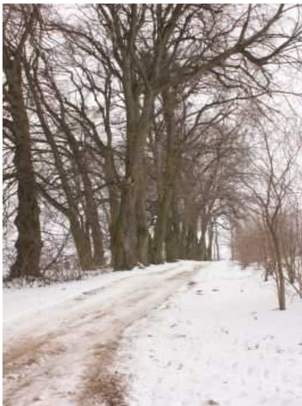
Rys. 14. Park

W 2 poł. XIX w. w miejscowości Peresołowice obecny był dwór i folwark obok, których rozciągał się park o powierzchni 3 ha. W czasie I wojny światowej dwór i folwark zostały całkowicie zniszczone i już nigdy nie odbudowane, a park sukcesywnie zmniejszał swoją powierzchnię. W tej chwili są to już tylko niewielkie pozostałości. Usytuowany przy drodze gminnej, wysoki stopień zdewastowania. Brak infrastruktury parkowej typu ogrodzenie, tablice informacyjne, czy też oświetlenie. W Parku występuje duża różnorodność drzew takich jak: Brzoza, Lipa, Grab, Olcha, Wierzba.