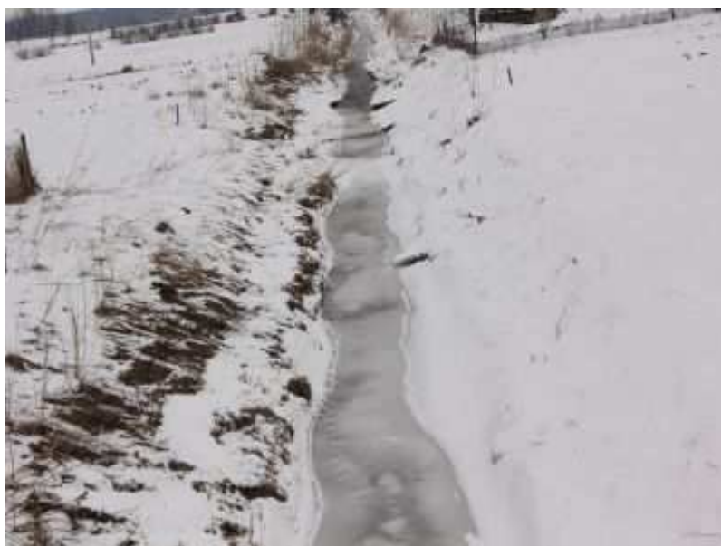
Rys. 5. Rzeka Henrykówka

Korytarz ekologiczny biegnący wzdłuż doliny niewielkiej „rzeczki” Henrykówki, na którym zachowany został naturalny krajobraz doliny, terenami łąkowymi i bagiennymi. Na terenie korytarza nie mogą być lokalizowane obiekty mogące zagrażać środowisku naturalnemu tj.: zakłady przemysłowe, obiekty rolnicze, obiekty gospodarcze. Wskazane jest natomiast lokalizowanie ścieżek pieszych i rowerowych, realizowanych w taki sposób, aby nie został naruszony naturalny układ zadrzewień, łąk oraz pól uprawnych.