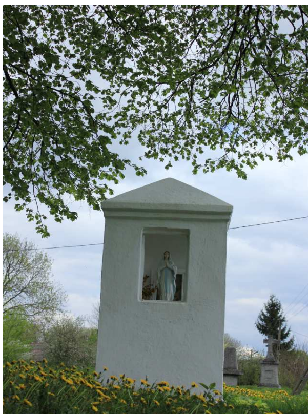
Rys. 11. Murowana kapliczka na cmentarzu przycerkiewnym.