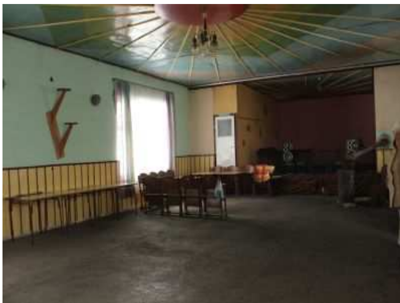
Rys. 16. Część świetlicowa ze scena.