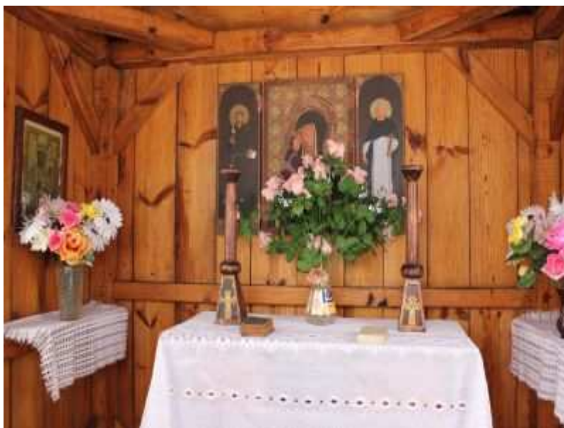
Rys. 9. Wnętrze przydrożnej kapliczki drewnianej wykonanej przez studentów z Łodzi.