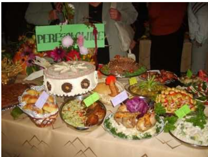
Rys. Biesiada u sołtysa