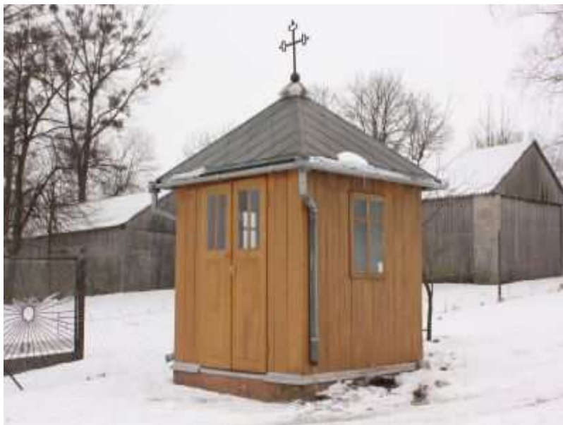
Rys. 8. Przydrożna kapliczka drewniana wykonana przez studentów z Łodzi w ramach pracy dyplomowej w 1993 roku.