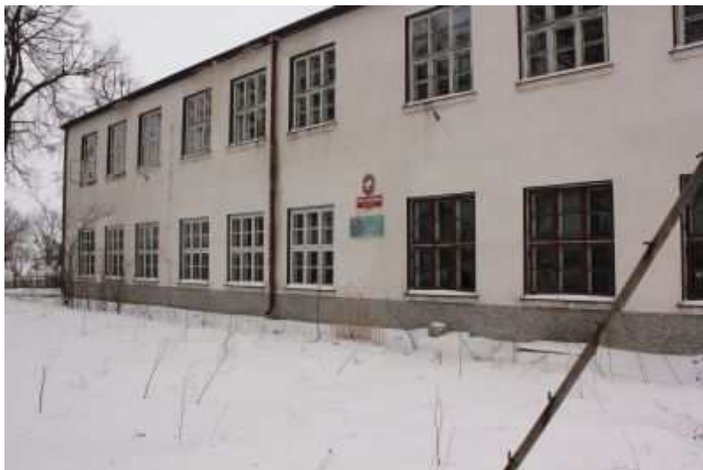
Rys. 4. Nieczynny od 1999 roku budynek Szkoły Podstawowej

na małą ilość dzieci, zlikwidowano ostatecznie w 1999 roku.