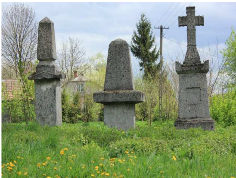
Rys. 13. Trzy kamienne nagrobki – jedyne pozostałości na cmentarzu przy cerkiewnym.