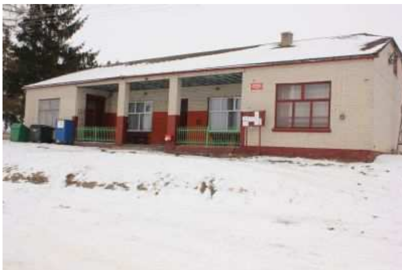
Rys. 15. Budynek świetlicy-remizy wraz ze sklepem.