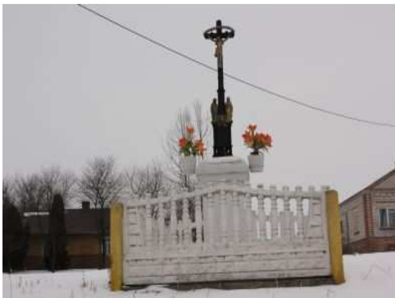
Rys. 12. Żeliwny krzyż na cmentarzu przycerkiewnym.