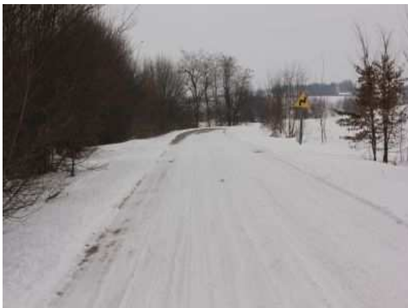
Rys. 20. Droga powiatowa Hostynne – Zaborce.