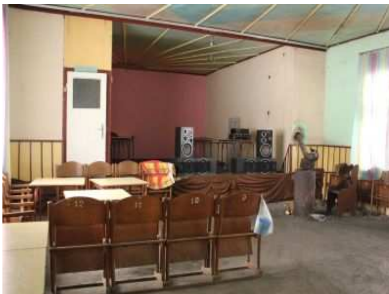
Rys. 17. Scena i wejście do szatni.