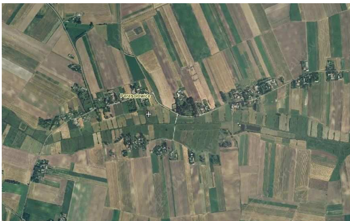
Rys.3. Peresotowice z lotu ptaka