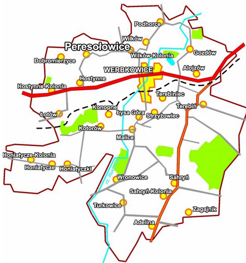
Rys. 2. Miejscowość Peresotowice na tle gminy Werbkowice