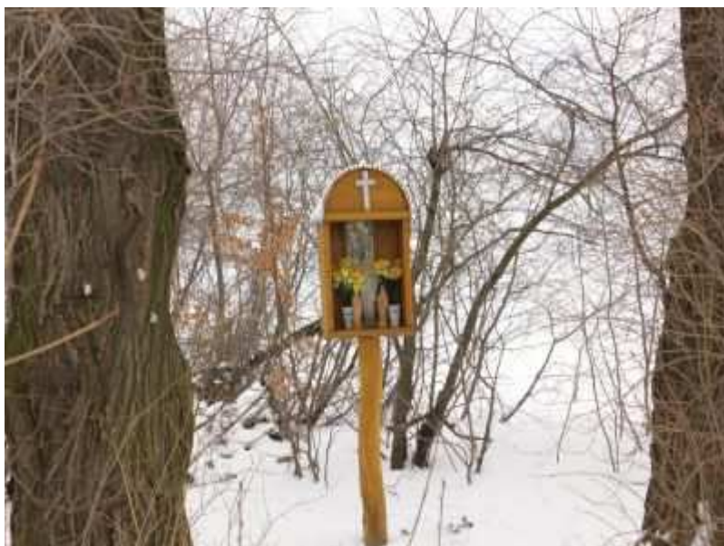
Rys. 10. Przydrożna kapliczka drewniana z pocz. XX wieku.