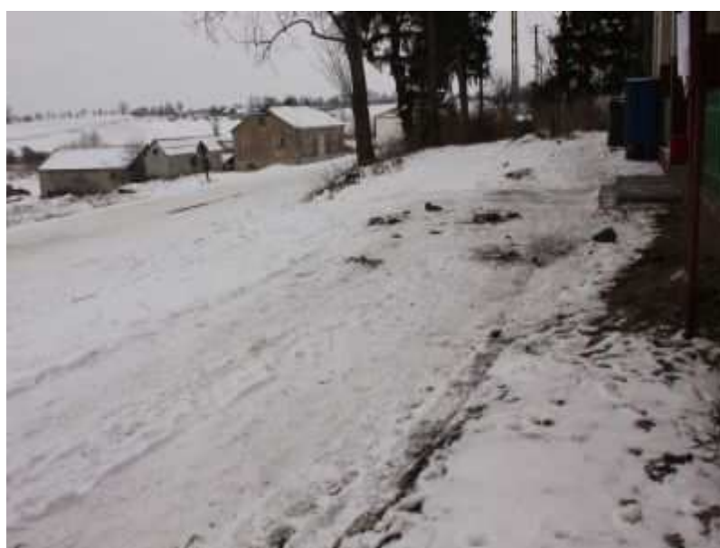
Rys. 18. Plac przed świetlicą-remizą.