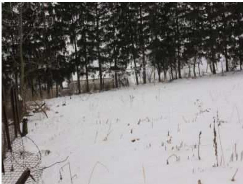
Rys. 19. Boisko do piłki nożnej

brak infrastruktury przy boiskowej typu: zaplecze sportowe, ogrodzenie, trybuny).