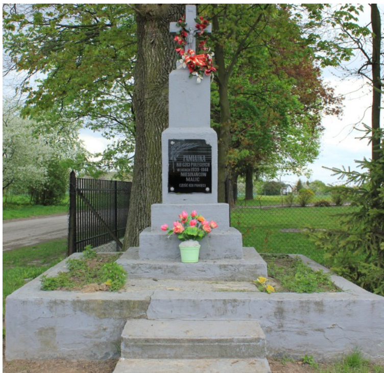
Rys. 6. „Pomnik ku czci poległych w latach 1939-1944 mieszkańców Malic - Cześć ich pamięci”