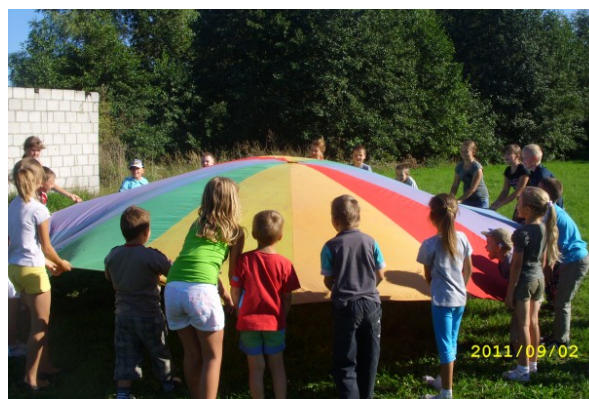
Rys. 19. Zabawy dla dzieci