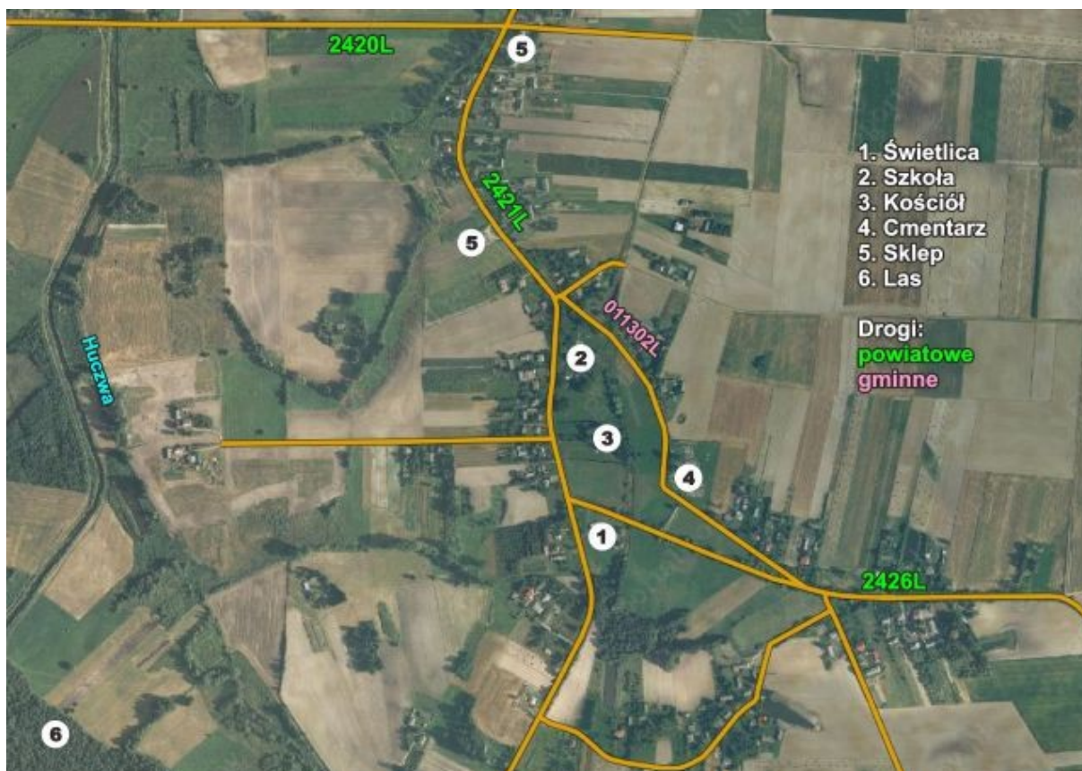
Rys. 4. Wizualizacja obszaru o szczególnym znaczeniu dla zaspokojenia potrzeb mieszkańców, sprzyjającego nawiązaniu kontaktów społecznych, ze względu na położenie oraz cechy funkcjonalno-przestrzenne ujęte z lotu ptaka

Dane i potrzeby zamieszczone w opisie uzupełnione są innymi zapisami ww. dokumencie m. in. w pozycji „Struktura przestrzenna miejscowości”, „Obiekty i tereny” oraz „Planowane zadania inwestycyjne i przedsięwzięcia aktywizujących społeczność lokalną”, stanowiąc komplementarną całość opisu miejscowości, jej charakterystyki i potrzeb.