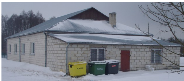
Rys. 15. Świetlica we wsi Malice