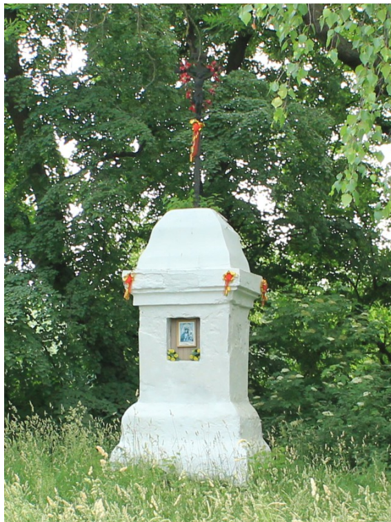
Rys. 7. Przydrożny krzyż żeliwny na czworobocznym cokole murowanym z 1870 roku

Na terenie miejscowości znajduje się przydrożny krzyż konstrukcji drewnianej z 1905 roku oraz 2 przydrożne krzyże konstrukcji metalowej upamiętniające poległych mieszkańców Malice w czasie II Wojny Światowej.