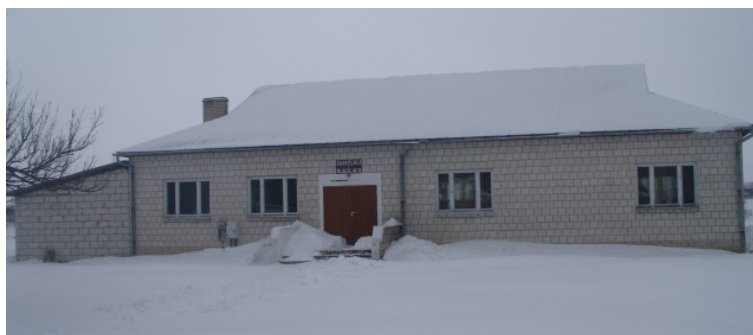
Rys. 14. Świetlica we wsi Malicach