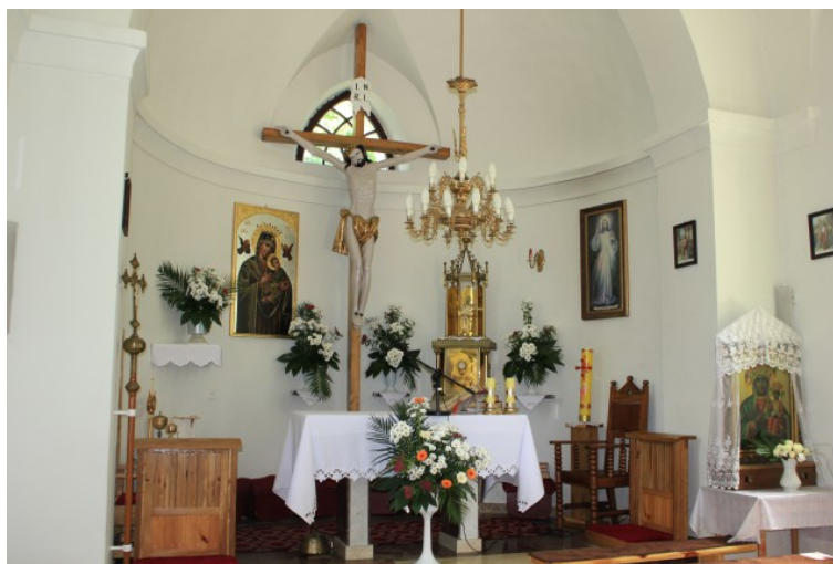
Rys. 10. Wnętrze kościoła