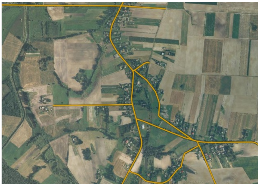
Rys. 3. Malice - "Widok z lotu ptaka"

Powierzchnia gminy Werbkowice zajmuje 18 565,94ha (miejscowość Malice 665, 36 ha, w tym użytki rolne stanowią 578,74 ha, natomiast lasy 35,61 ha). Gminę Werbkowice tworzy 28 sołectw, w tym sołectwo Malice. Jest gminą rolniczo-przemysłową z nastawieniem na przemysł rolno-spożywczy.