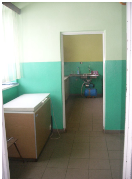
Rys. 16. Pomieszczenie socjalnego