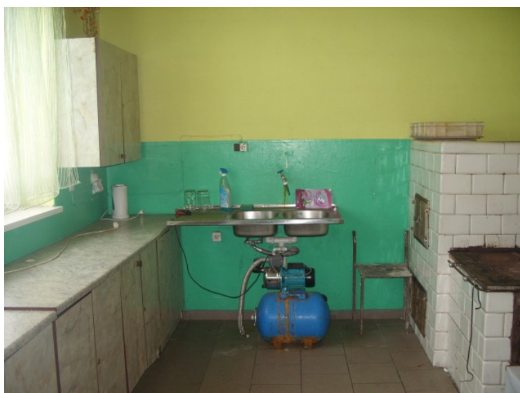
Rys. 18. Pomieszczenie kuchenne