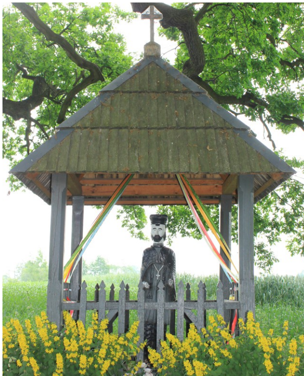
Rys. 8. Kapliczka przydrożna z rzeźbą św. Jana Nepomucena z 1477 roku