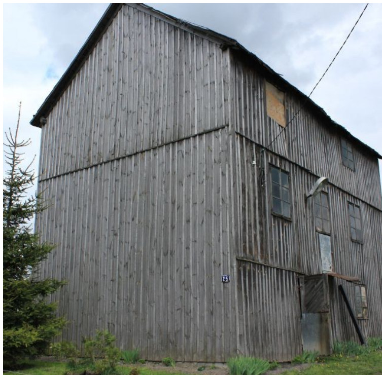
Rys. 12. Młyn w Malicach

odcinkowo, bez obramowań o wielokwaterowej stolarce, mniejsze w górnej kondygnacji. Drewniane skrzydła w otworach wejściowych.