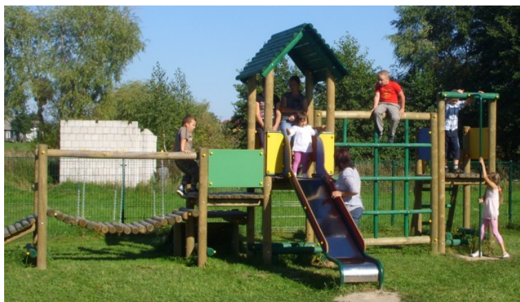
Rys. 21. Plac zabaw obok świetlicy