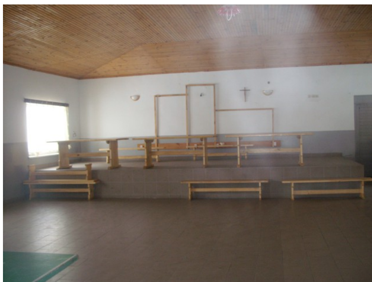
Rys. 17. Sala taneczna ze sceną