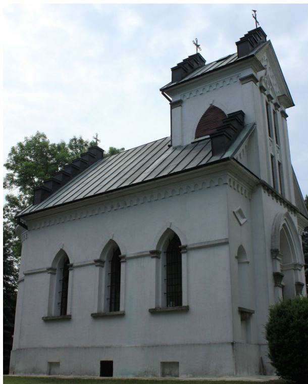
Rys. 9. Kościół w Malicach