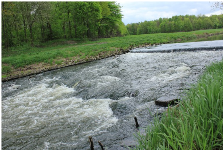
Rys. 5. Huczwa

Na terenie gminy Werbkowice widoczny jest brak wykorzystania potencjału sportowo-rekreacyjnego i stricte turystycznego rzeki Huczwy i terenów bezpośrednio do niej przyległych o bardzo dużej powierzchni. W samej miejscowości Malice, jak i na terenie Gminy Werbkowice brakuje infrastruktury około rzecznej. Instytucje prowadzące działalność rekreacyjno-sportową, czy też osoby fizyczne prowadzące działalność agroturystyczną, nie wykorzystują potencjału rzeki, która w znaczący sposób stworzyłaby możliwość rozwoju sektora rekreacyjno-sportowego oraz uzyskania większych dochodów zarówno dla miejscowości Malice, jak i całej gminy.