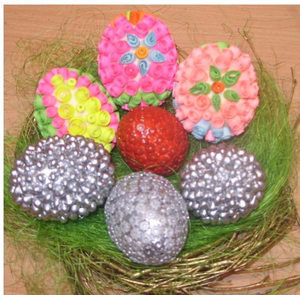
Rys.13. Kompozycje wykonane przez Panie z KGW