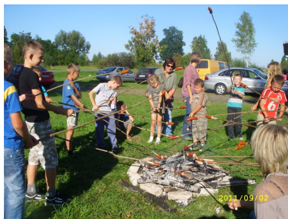
Rys. 20. Spotkania integracyjne i aktywujące społeczność lokalną