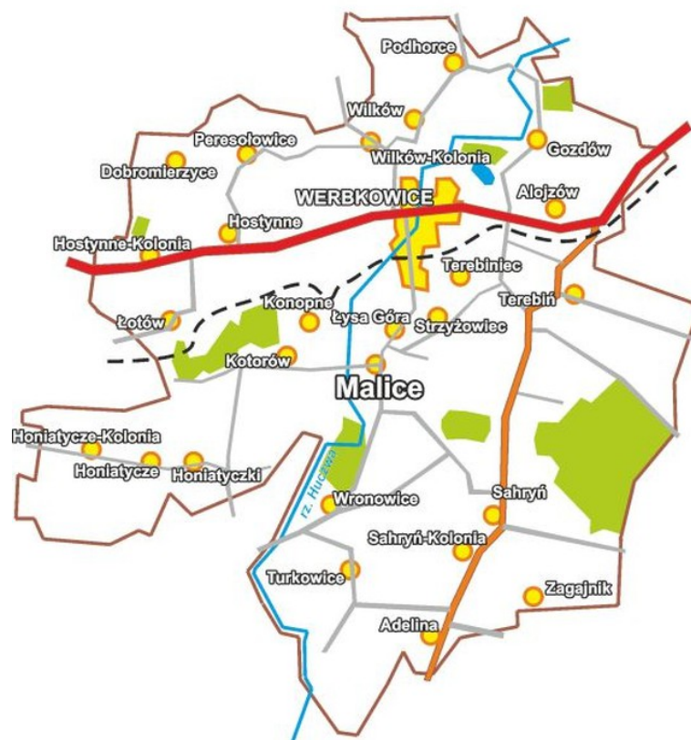
Rys. 2. Miejscowość Malice na tle gminy Werbkowice